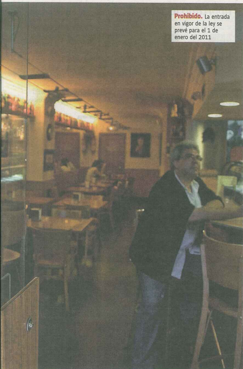
Prohibido. La entrada en vigor de la ley se prevé para el 1 de enero del 2011

cia. Se mantiene, sin embargo, el permiso para fumar en plazas de toros, estadios deportivos y demás instalaciones al aire libre, así como en parques infantiles y en recintos sanitarios o educativos en espacios abiertos.